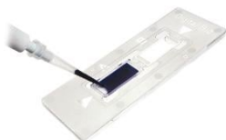
Lame de comptage Malassez